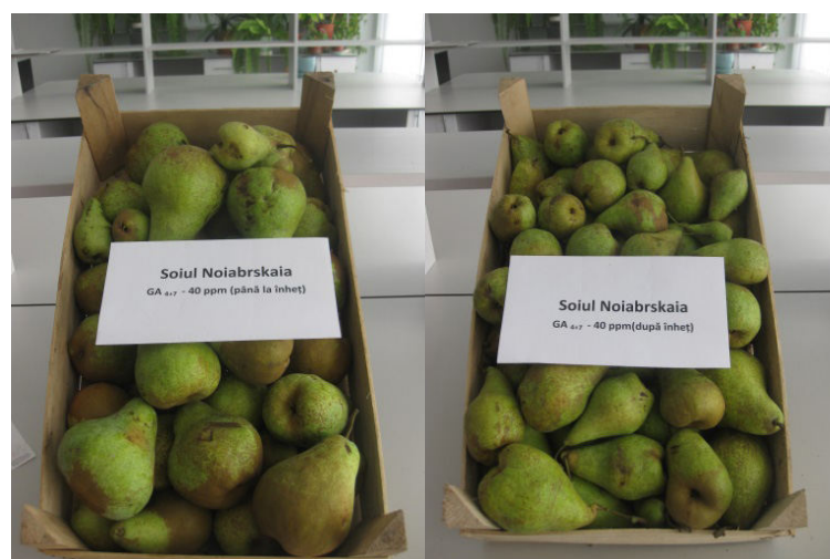
Figura 3. Calitatea perelor din soiul Noyabrskaya tratate cu regulatori de creștere