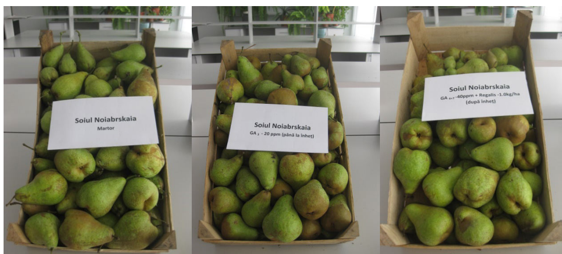
Figura 2. Calitatea perelor din soiul Vystavocnaia tratate cu regulatori de creștere