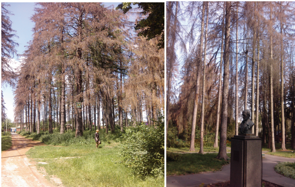
Рисунок 2. Массовое усыхание ели европейской в парках-памятниках садово-паркового искусства Винницкой области

На данный момент первоочередной задачей в процессе формирования оптимальной экологической сети Винницкой области является увеличение количественного показателя природно-заповедных территорий в пределах сводной схемы региональной экологической сети. По данным департамента экологии и природных ресурсов Винницкой областной государственной администрации общее количество из 555 объектов и территорий природно-заповедного фонда составляет 60 тыс. га или 2,28% от общей площади области (Елисавенко, Ю.А. 2013).