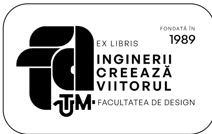
Figura 6. Contribuții privind elaborarea ex-librisului dedicat Facultății de Design

În rezultatul analizei efectuate privind evoluția abordărilor estetice ale ex-librisurilor au fost elaborate prin contribuții proprii la elaborarea conceptului estetic al ex-librisului dedicat bibliotecii Facultății de Design (Fig. 6).