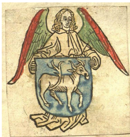
Figura 2. Ex-libris-ul lui Hildebrand Branderburg din secolul XV, expus în Arhivele Universității Farber [4]

În epoca contemporană ex-librisurile s-au redus în popularitate, căpătând un caracter pur decorativ și fiind mai degrabă un mijloc de exprimare artistică decât un element funcțional și indicator al statutului social.