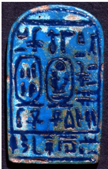
Figura 1. Plăcuță ceramică egipteană cu ex-libris expusă la Muzeul Britanic [7]