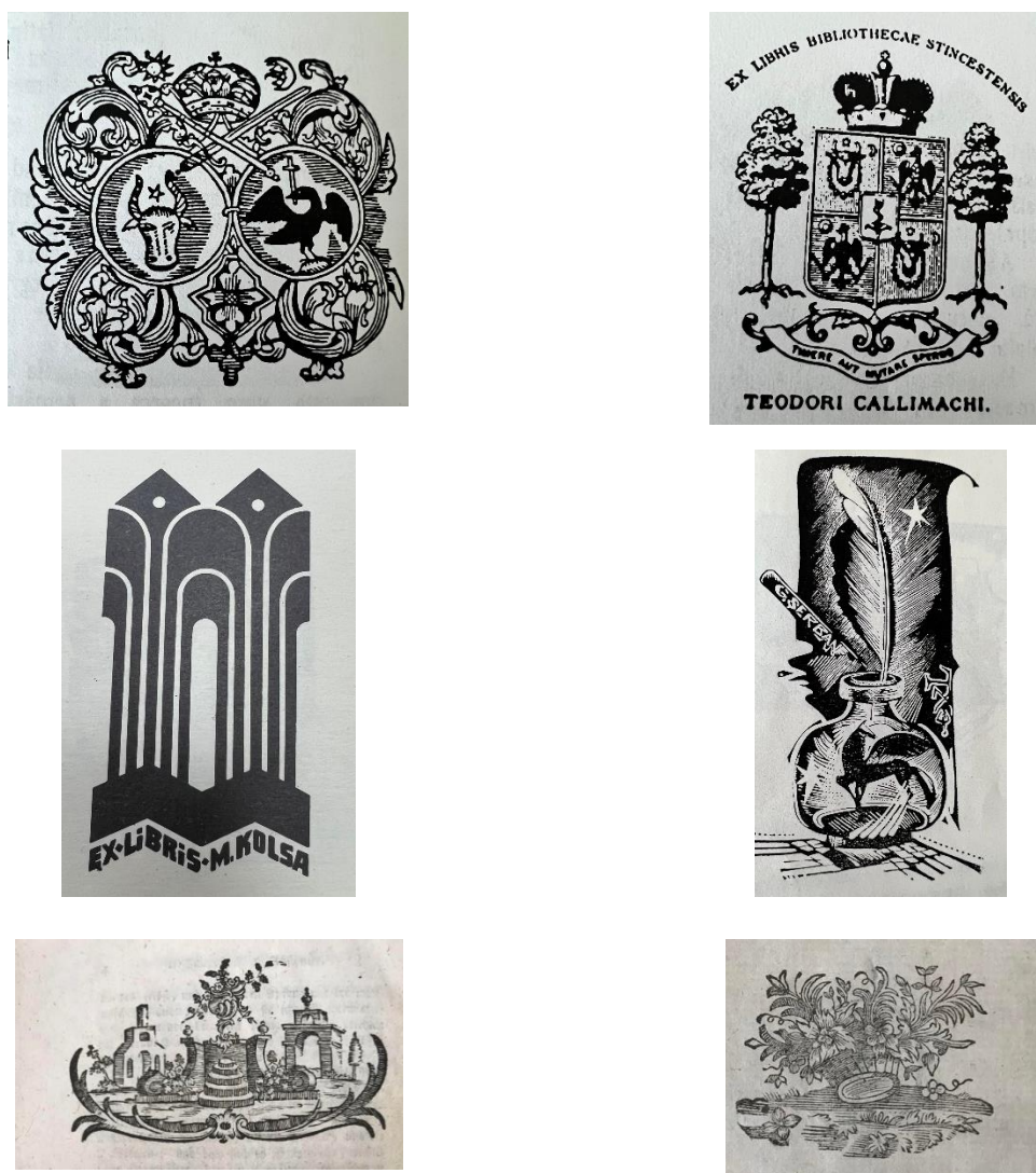
Figura 5. Ex-libris-ri ale edițiilor de carte identificate în Secția Carte Veche și Rară, BNM