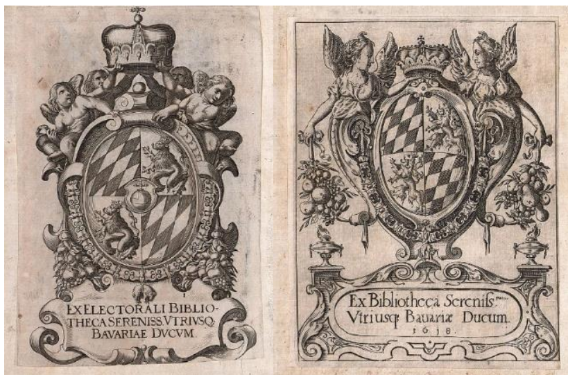
Figura 3. Ex-libris-uri germane din secolul al XVII-lea [3]

La începutul epocii moderne, aceste sintagme, cât și alte comentarii, erau scrise în încadrări ornamentate sau pe dantele. Ulterior, s-a recurs la scrierea numelui propriu în partea inferioară sau superioară a plăcuței de carte, iar unii artiști chiar l-au încorporat ca parte integră a ilustrației grafice.