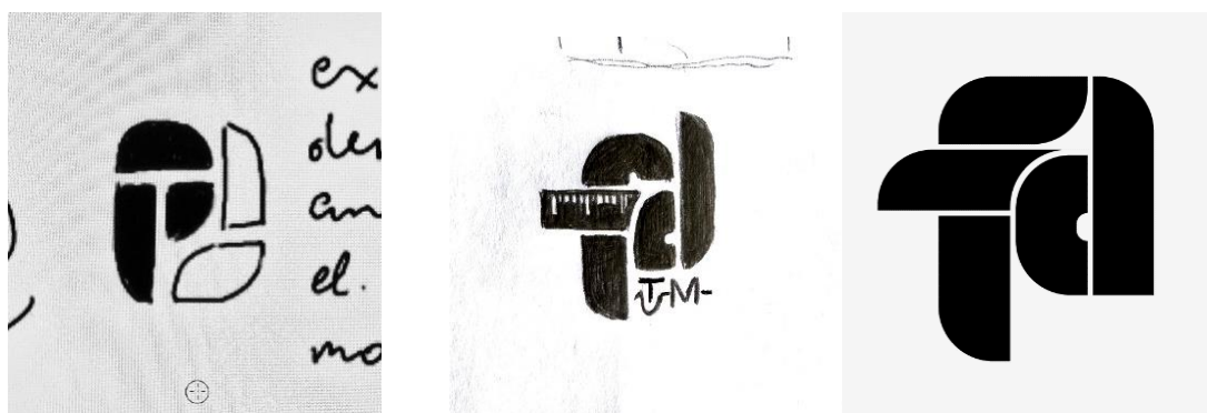
Figura 7. Schițe de dezvoltare a conceptului ex-librisului universitar

În vederea percepției ușoare și clare a bibliotecii căreia îi aparține cartea, ex-librisul a fost introdus într-un încadrământ dreptunghiular cu colțurile rotunjite.