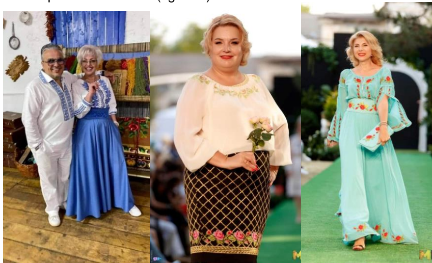
Figura 3: Modele de produse contemporane ornate cu motive vegetale florare

De-a lungul timpului, ornamente florale au evoluat și s-au adaptat la schimbările sociale și culturale, rămânând o valoare importantă în cadrul comunității moldovenești exprimate prin crearea unor produse contemporane deosebite (figura 3).