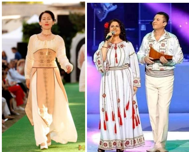
Figura 3: Modele de produse contemporane ornamentate cu motive vegetale florare

Imprimeurile și broderiile cu motive florale naționale adaugă o notă de autenticitate și unicitate hainelor contemporane. Acestea pot fi integrate în diferite piese vestimentare aducând o doză de culoare și personalitate în garderoba noastră. De asemenea ele reprezintă o modalitate de a transmite și promova tradițiile și valorile culturale ale neamului nostru.