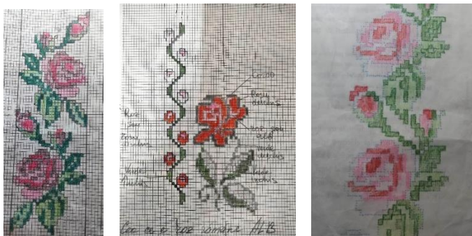
Figura 1: Ornamentare vegetală cu trandafiri

Un alt motiv floral întâlnit în costumele populare moldovenești este floarea-soarelui, care reprezintă bucuria și speranța. Aceste ornamente sunt adesea realizate cu ajutorul broderiei sau al țesăturilor în culori vibrante.