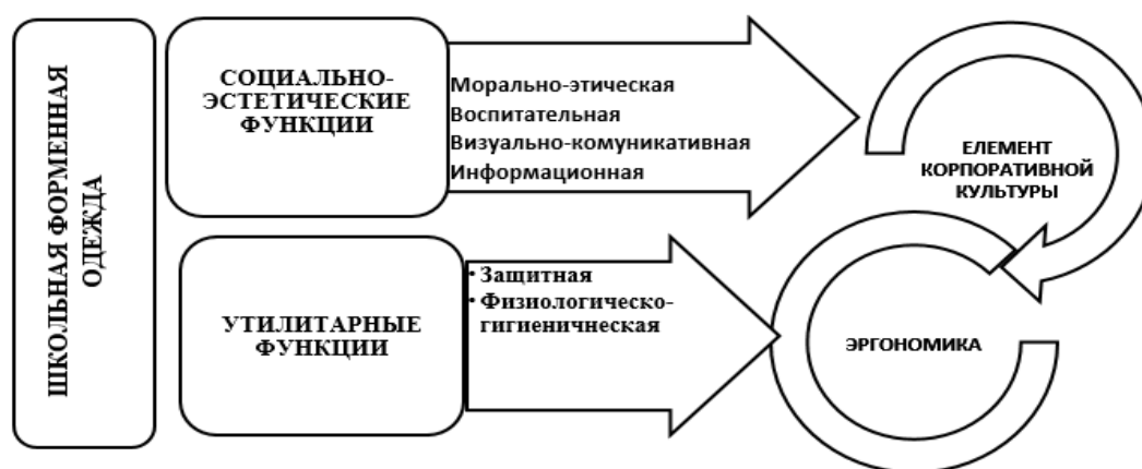
Рис. 1. Основные функции школьной форменной одежды

Следует отметить, что при проектировании форменной одежды для детей дизайнеры должны не только уделить повышенное внимание гармония в пропорциях и композиции костюма, но и обеспечить соответствия одежды особым потребностям тела ребенка разных возрастных групп, требованиям эргономичности и психологического комфорта ребенка (рис. 1). Это непосредственно влияет на задачи, которые должны быть поставлены и решены при проектировании школьной форменной одежды дизайнером [1].