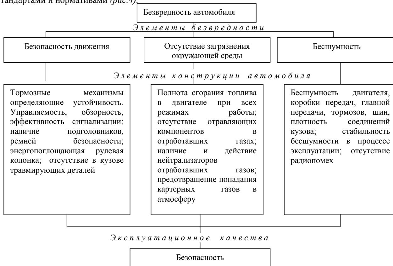
Рис. 4 Зависимость безвредности использования автомобиля от элементов его конструкции

В последние годы особое внимание уделяется безвредности использования автотранспортных средств. Этот элемент эффективности строго регламентируется международному и национальными стандартами и нормативами (рис.4).